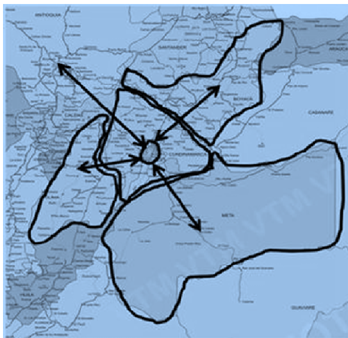
Figura 1. Esquema de la Región Central

El proyecto Fortalecimiento de la Capacidad en el Planeamiento y Gestión del Desarrollo Regional, (objeto del Convenio INT12X03) busca fortalecer los lineamientos de política pública de integración regional para Bogotá y sus territorios vecinos mediante la gestión y armonización de los mecanismos de planeación, ordenamiento territorial e integración regional relacionados con temáticas de interés regional.